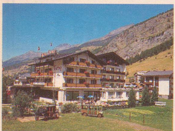
***HOTEL Touring HALLENBAD

Information: Hotel Alpha Fam. Gottlieb Bumann 3901 Saas-Grund Telefon 028/57 20 06