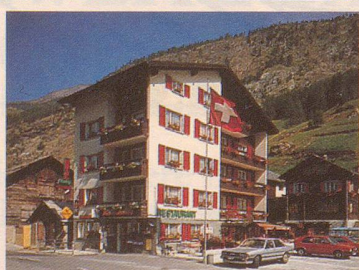
★★ Hotel Restaurant Roby

Unser Ziel: Zufriedene Gäste Familie Jules Bumann-Zurbriggen CH-3901 Saas-Grund Tel. 028/57 21 27 Telex 38669 CH HOTOU