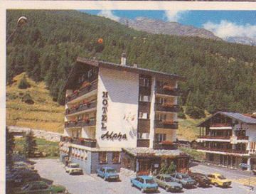
Das gepflegte Haus mit persönlicher Note ist zentral gelegen, 250 m von den Bergbahnen entfernt. Alle Zimmer mit Bad/Dusche, WC und Balkon.

Gepflegtes Haus mit familiärer Atmosphäre. Komfort — Ruhe — Erholung. Alle Zimmer mit Bad/Dusche, WC, Telefon, Balkon. Gemütliches Restaurant. Jägerstübli im Walliser Stil. Aufenthaltsraum. Sonnenterrasse. Lift. Parkplatz.