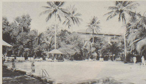
Hotel Sanur Beach