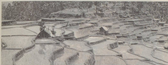
Reisterrassen auf Bali

Eine einmalige Reisekombination Spezialausflüge und Ausflugsprogramme auf Anfrage!