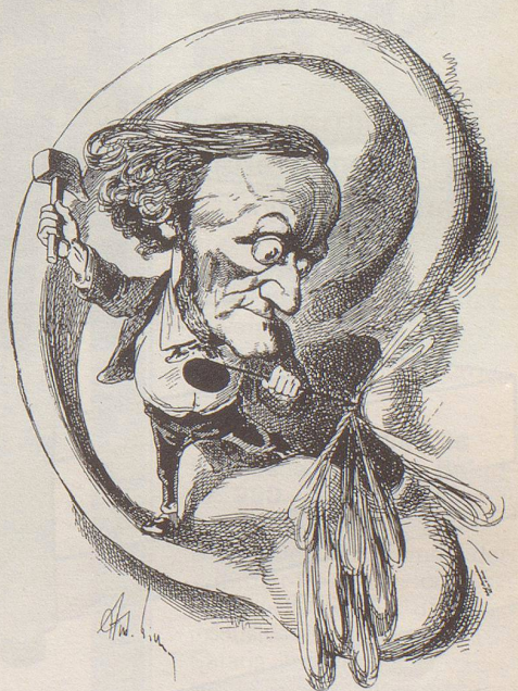
Richard Wagner in der Karikatur (gezeichnet von Gill in L'Eclipse , einer Wochenzeitung, die in Paris erschien)

Die Musik ist heutzutage Wohl der Menschheit grösste Plage Schauervolles wird erreicht Wenn der Mensch die Geige streicht Oder in der Abendröte Zwecklos bläst auf einer Flöte.