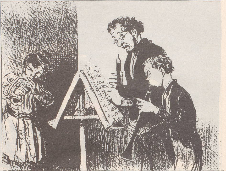
Das Hauskonzert (von Honoré Daumier, 1847)

Abraham a Santa Clara (1644–1709), der sprachgewandte Prediger und grosse Freund kirchlicher Musik, kritisierte ein schon damals in Erscheinung tretendes Virtuositum sehr scharf: «Ob zwar singen und musizieren ein englisches Amt, so seynd sie doch unter den Musikanten wenig Engel, wohl aber viel Bengel und Sau-Nar-