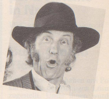
César Keiser Aus Karli Knöpfli's Tagebuch

48 Seiten, Fr. 12.80 Nebelspalter-Verlag, Rorschach