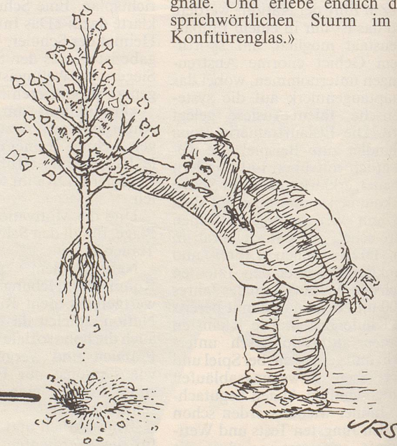
Wer das Bäumchen nicht ehrt, ist des Waldes nicht wert!