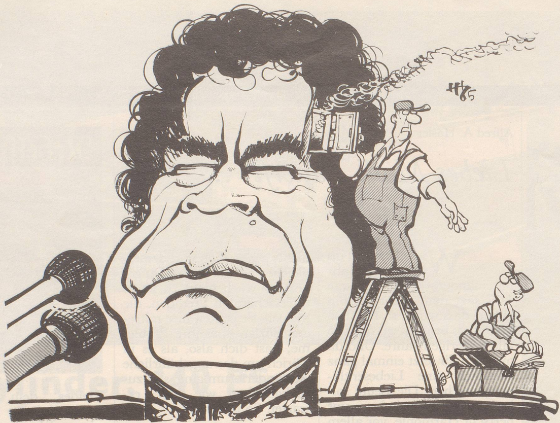
«Den Schraubenschlüssel und eine neue Sicherung!»