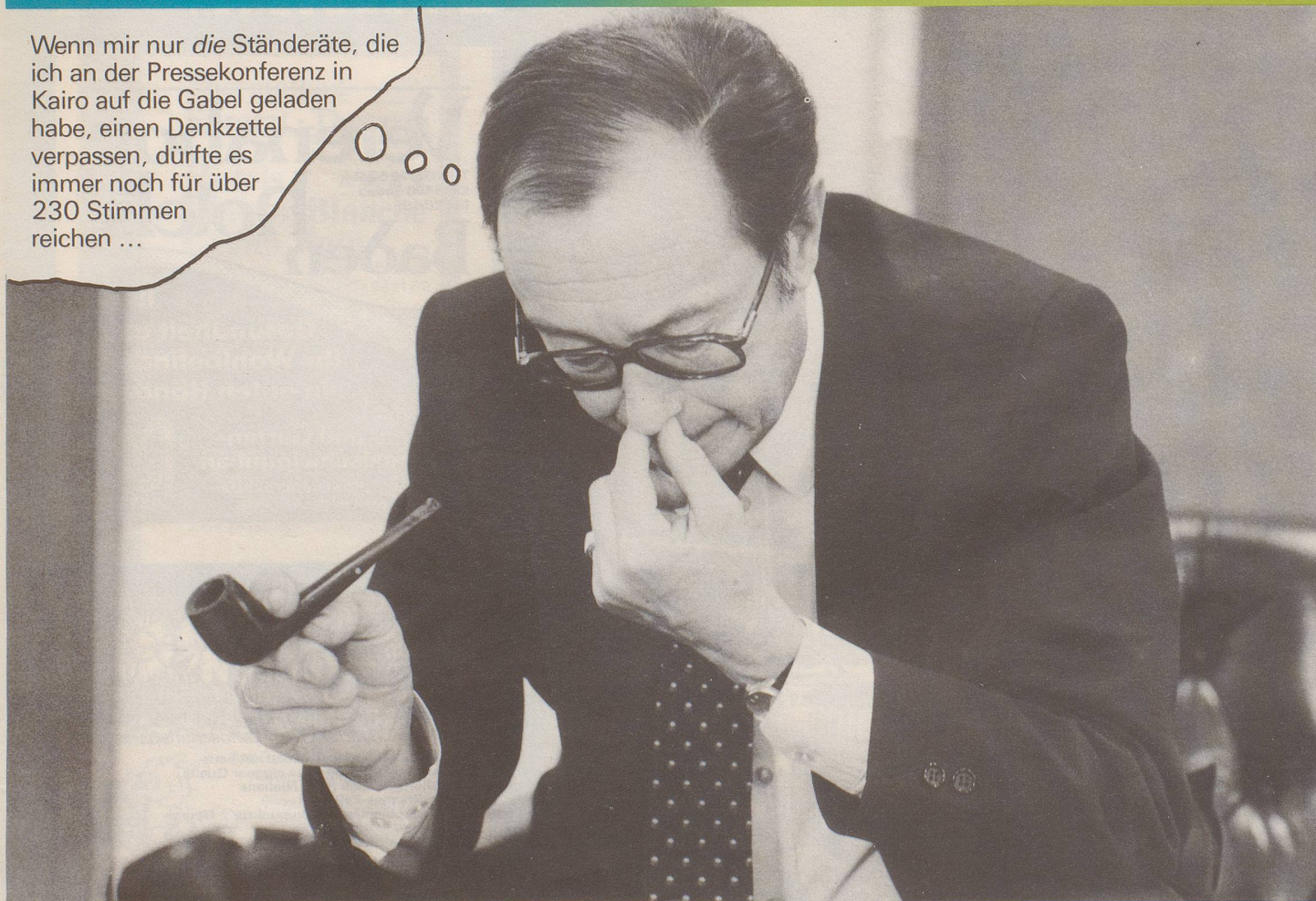
Bild (Bundesrat Pierre Aubert wartet auf das Ergebnis für seine Wahl zum Vizepräsidenten des Bundesrats)