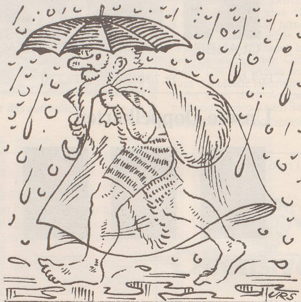
Klimaverschiebung? Problem gelöst!

Vielleicht habe ich eine Möglichkeit, Ihnen zu sagen, wann das Buch ganz fertig ist, wo Sie es bekommen können und was es kostet.