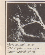
Makroaufnahme von Teppichfasern, wie sie am Tatort zurückblieben.

«Die aufgeregte Stimme der Verkäuferin liess nichts Gutes ahnen. Ich sollte sofort kommen, in mein Orientteppichgeschäft sei eingebrochen worden.