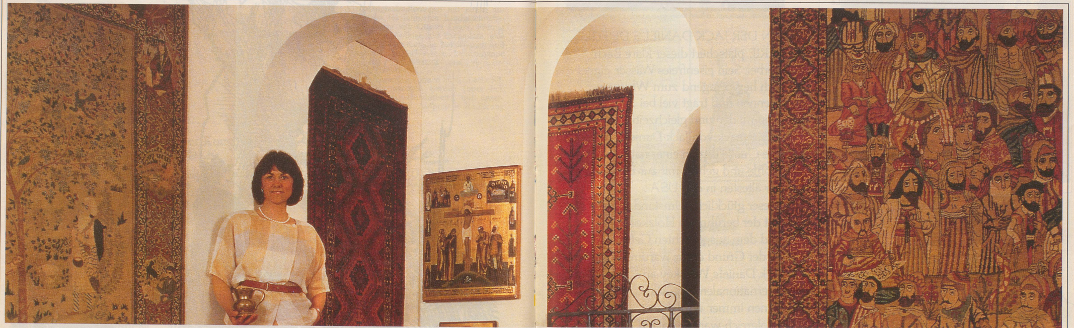
Linas SMV 1585 F

Die Video- und Telespiele simulieren Leben, wo nichts als audiovisuelle Trostlosigkeit herrscht; sie nähren die kindliche Sehnsucht nach Abenteuer und bieten nichts als die schwache Illusion davon; sie lähmen die Kreativität und versetzen in einen Zustand der Untätigkeit; sie fesseln durch eintönige Wiederholung, welche die geistigen Kräfte bis zur Bewusstlosigkeit einschläfert. Mit diesen Computerspielen gelingt es uns, der Phantasielosigkeit zum endgültigen Durchbruch zu verhelfen! Peter Fahr