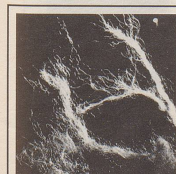
Makroaufnahme von Teppichfasern, wie sie am Tatort zurückblieben.

«Die aufgeregte Stimme der Verkäuferin liess nichts Gutes ahnen. Ich solle sofort kommen, in mein Orientteppichgeschäft sei eingebrochen worden.