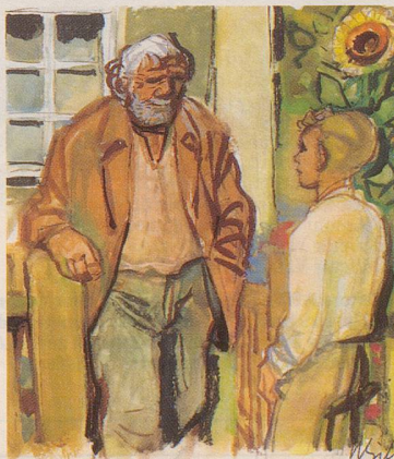
Karl – Die Geschichte einer Freundschaft

Karl – Die Geschichte einer Freundschaft. Zum Schenken oder für einen selber! Sie können das Buch beziehen beim Sekretariat des Deutschschweizerischen Sonntagschulverbandes, 8415 Berg am Irchel; telefonisch 052/42 18 32 oder mit nebenstehendem Coupon.