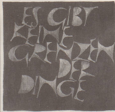
Blatt April aus dem Schriftteppich-Kalender des Wilhelm Kumm Verlags. Dieser in Brauntönen gehaltene Schriftteppich stammt von Hans Schmidt/Gobelinwerkstatt Mohrhardt-Richter.