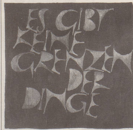
Blatt April aus dem Schriftteppich-Kalender des Wilhelm Kumm Verlags. Dieser in Brauntönen gehaltene Schriftteppich stammt von Hans Schmidt/Gobelinwerkstatt Mohrhardt-Richter.