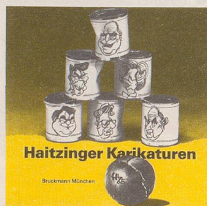
Horst Haitzinger Haitzinger Karikaturen 85 72 Seiten, gebunden, Fr. 15.80