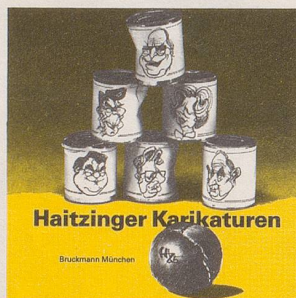
Horst Haitzinger Haitzinger Karikaturen 85 72 Seiten, gebunden, Fr. 15.80