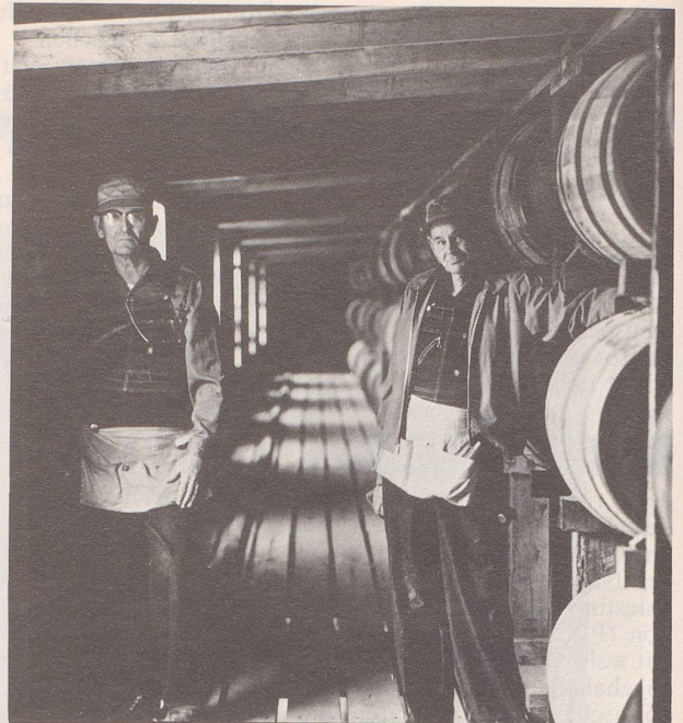
If you would like a booklet about Jack Daniel's Whiskey, write us to Lynchburg, Tennessee 37352, USA

Senkrecht: 1 Bonus, 2 Auskunft, 3 Ares, 4 Rallye, 5 Rio, 6 mia, 7 Dame, 8 me, 9 Sinus, 10 ge, 11 Mir, 12 anfangs, 13 BE, 14 Lola, 15 Straus, 16 Pa, 17 Patin, 18 Els, 19 Mango, 20 itt, 21 Arie, 22 Motte, 23 Eva, 24 Ah, 25 bedeutet, 26 NW, 27 Spengler, 28 Rialto, 29 Epik, 30 on, 31 Menge, 32 net, 33 es, 34 Haile (Selassie), 35 WT, 36 il, 37 RL, 38 Linda, 39 lau, 40 Historie, 41 Tenn, 42 Projekte, 43 Drang.