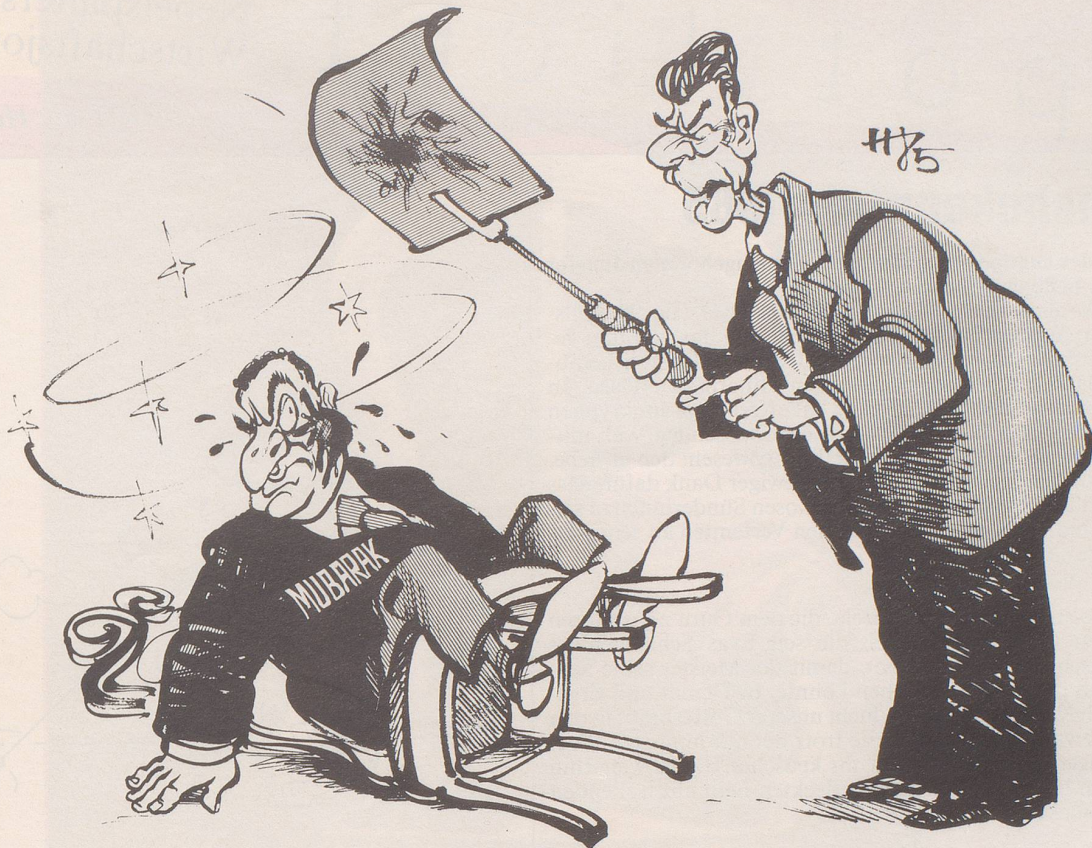
«Sorry, auf Ihrer Backe sassen vier Wespen!»