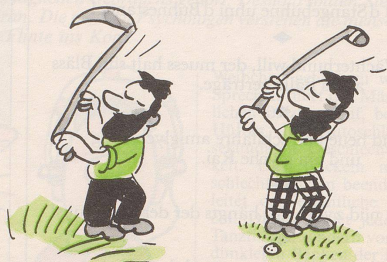
Für Bergbauern: Golf