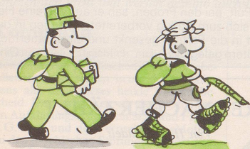
Für Briefträger: Wandern

Für jeden Beruf gibt es zum Ausgleich eine ideale Freizeitbeschäftigung: