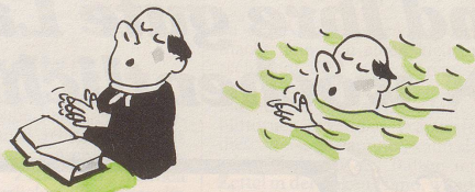
Für Pfarrer: Schwimmen