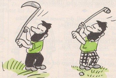
Für Bergbauern: Golf