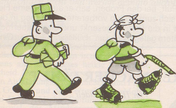
Für Briefträger: Wandern

Für jeden Beruf gibt es zum Ausgleich eine ideale Freizeitbeschäftigung: