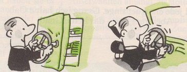
Für Bankangestellte: Autofahren