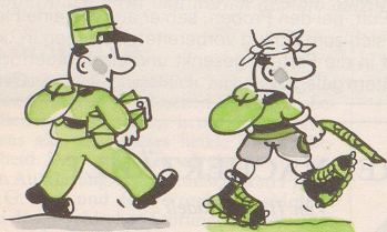
Für Briefträger: Wandern

Für jeden Beruf gibt es zum Ausgleich eine ideale Freizeitbeschäftigung: