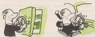
Für Bankangestellte: Autofahren