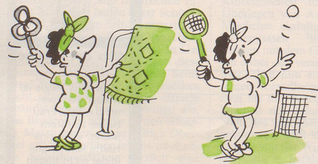
Für Hausfrauen: Tennis

Besonders glücklich sind jene, welche ihr Hobby zum Beruf machen können.