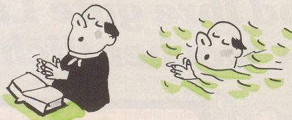
Für Pfarrer: Schwimmen