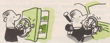
Für Bankangestellte: Autofahren