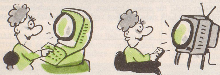
Für EDV-Fachleute: Fernsehen