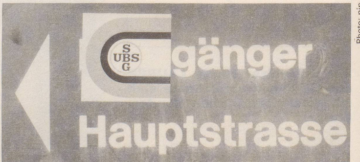
(Geknipst im Zentrum von Binningen BL)