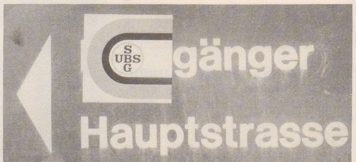
(Geknipst im Zentrum von Binningen BL)