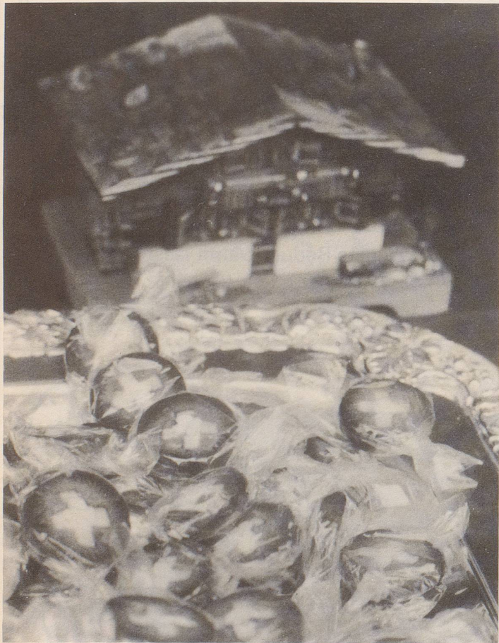
Verschleckte Schweizer sind sich bewusst der Bedeutung des 1. August ...