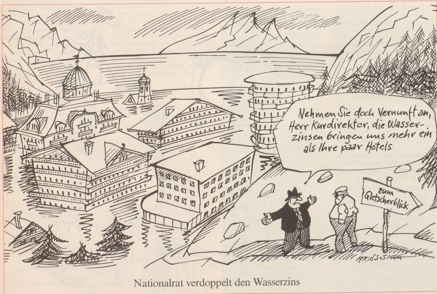
Nationalrat verdoppelt den Wasserzins