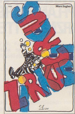
Zirkus – Circus (Nr. 1684)

von Marc Ingber Illustrationen: Brigitte Frey-Bär Reihe: Sachhefte (ab 8 Jahren)