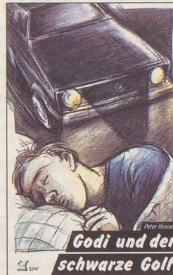
Godi und der schwarze Golf (Nr. 1706)

von Peter Hinnen Umschlagbild: Marianne Sinner Reihe: Literarisches (ab 10 Jahren)