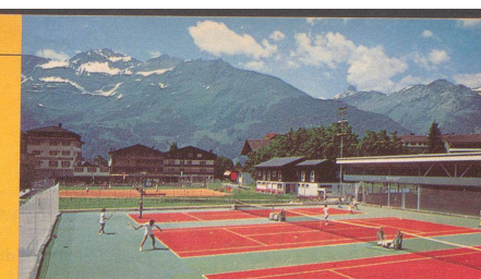
Dorfzentrum Wengen mit Tennisplatz

Auskünfte: Talstation Wengen, Tel. 036/55 29 33