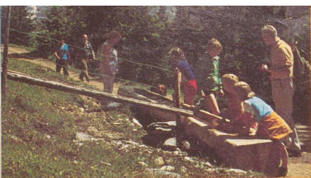
Wandergruppe auf der Mettlenalp