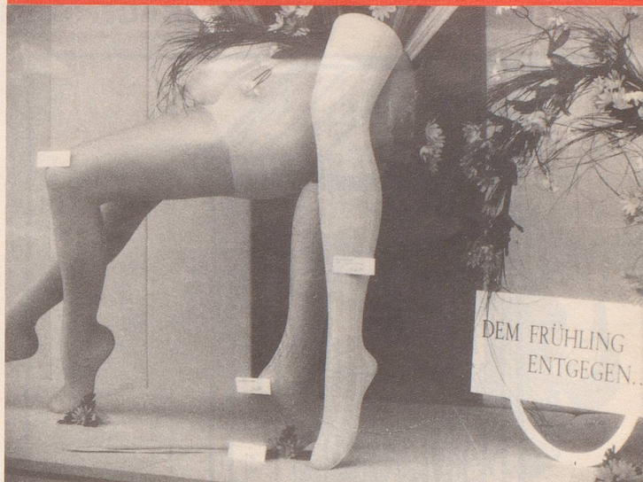
Diese Zeichen trügen kaum ...