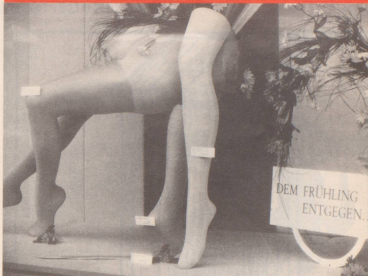
Diese Zeichen trügen kaum ...