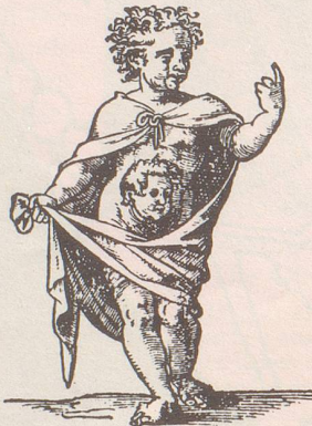
Das Bild links zeigt eine geschlechtliche und das Bild rechts eine ungeschlechtliche Vermehrung mittels Knospung. Letzteres ist ein Stich aus dem Jahre 1580.