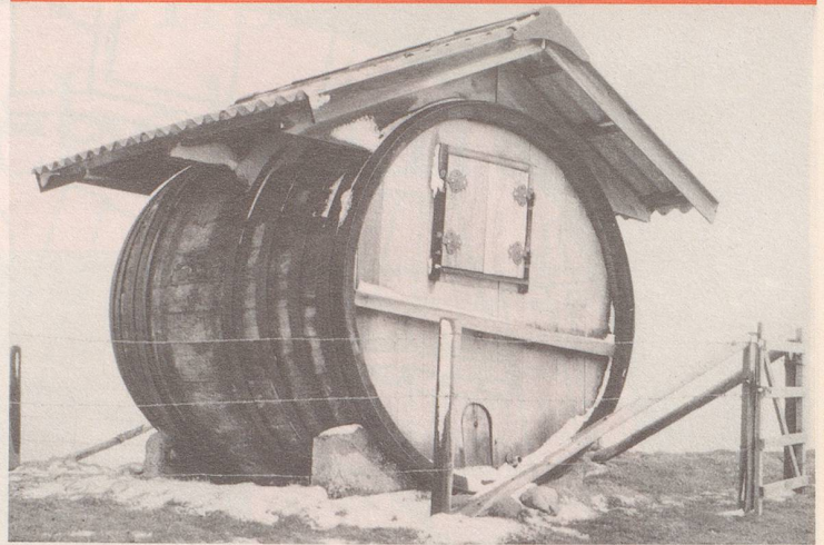
Kein Wunder, wissen die Weinbauern in guten Jahren nicht, wohin mit dem Rebensaftsegen, wenn sie die Fässer zu Lusthäuschen umbauen ...