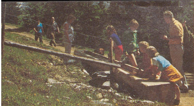
Wandergruppe auf der Mettlenalp