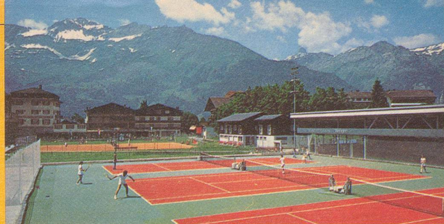
Dorfzentrum Wengen mit Tennisplatz