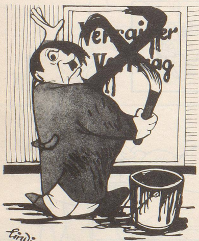
Adolf streicht den Versailler-Vertrag Adolf streicht weiter ...