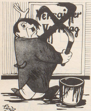
Adolf streicht den Versailler-Vertrag Adolf streicht weiter ...