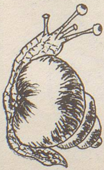
Auftakt zum Frühlingserwachen