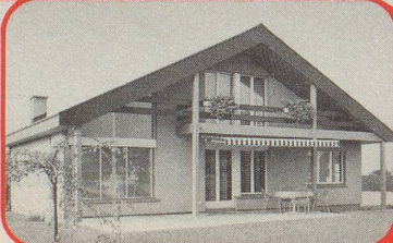
WZM • Biel