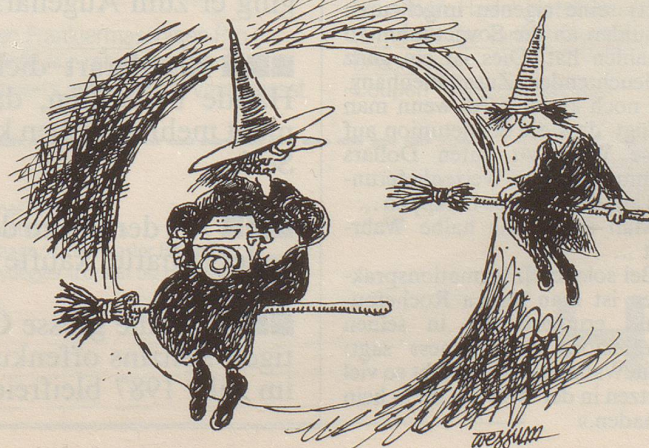
«Infrarot – und ich fand damit bereits einen Schatz: vergrabene hochgiftige Abfälle!»

Mehr Feuriges aus dem Zürcherland ein andermal!