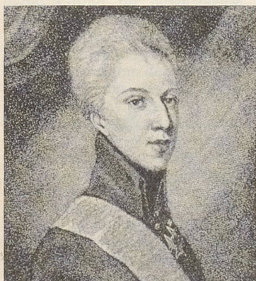
Gustav IV., König von Schweden, lebte als «Obrist Gustavson» in Basel und St.Gallen im Exil.

Als der Ex-König am 7. Februar 1837 starb «erstrahlte ein wunderbar schön glänzender Meteor in einzigartiger Pracht am St.Galler Himmel ...» Sic transit gloria Wasa.