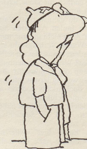
Den Schweizer Stimmbürgern voll fauler Ausreden