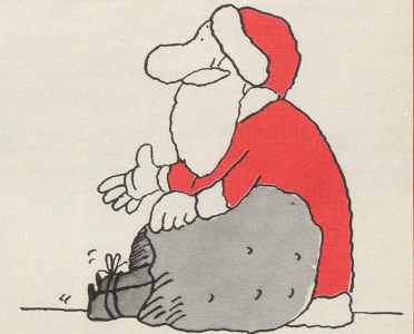
Dem Nebelspalter einen neuen Abonnenten!