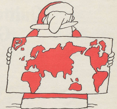
... und dem Herrn Tschernenko auch eine.