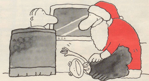
Den Fernsehzuschauern wieder mal eine lustige Sendung!