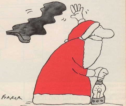
Der Landwirtschaft den jetzt leeren Sack, damit sie ihre Überschüsse verstauen kann.