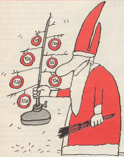
Dem Bundesrat das letzte, schön dekorierte Tännchen.