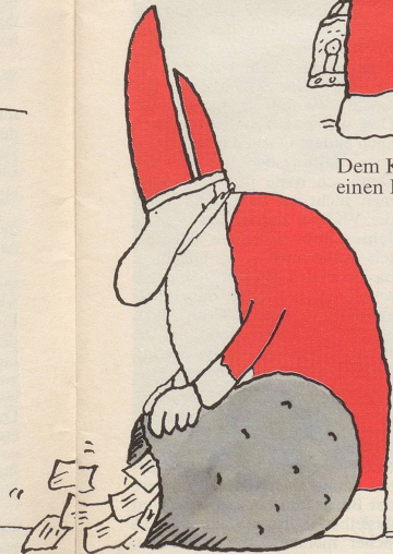
und Stimmbürgerinnen einen Sack fürs Nichtstimmen.