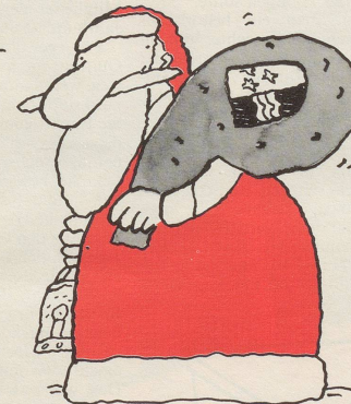
Dem Kanton Aargau endlich einen Bundesrat.