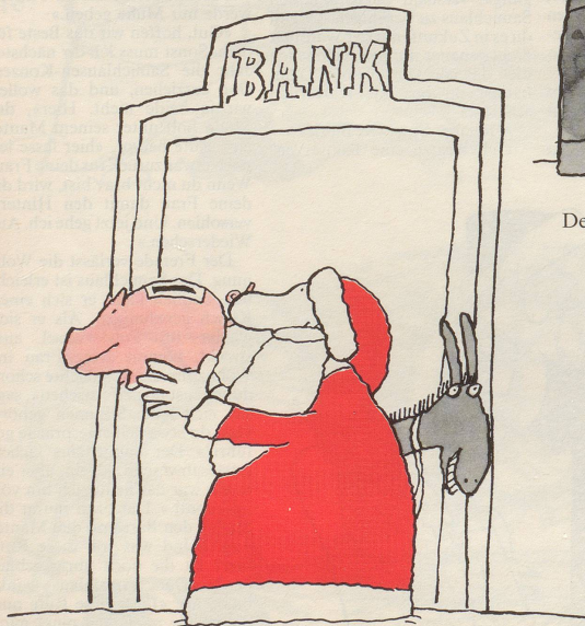
Dem armen Finanzplatz Schweiz etwas Spezielles.