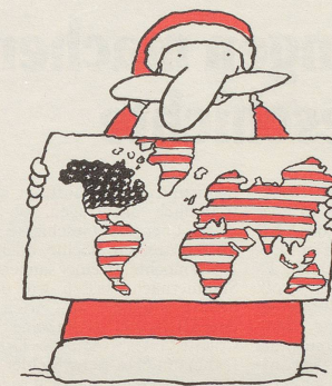
Dem Herrn Reagan eine neue Weltkarte ...