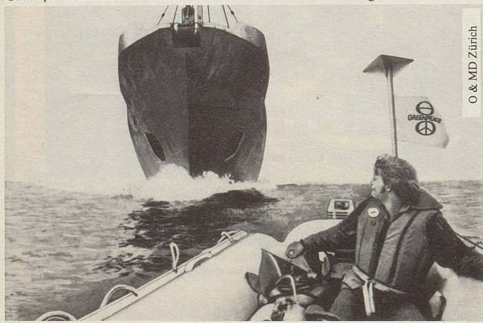
O & MD Zürich

Greenpeace dankt für den kostenlosen Abdruck dieser Anzeige.