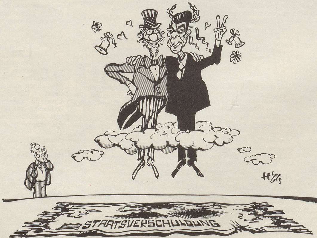
«Hallo Boys, wieder runterkommen!»