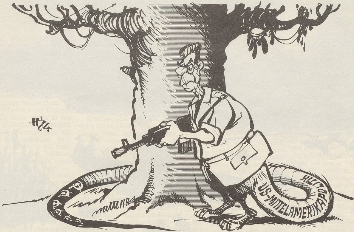
«Pfui Teufel, eine bösartige Giftschlange!»