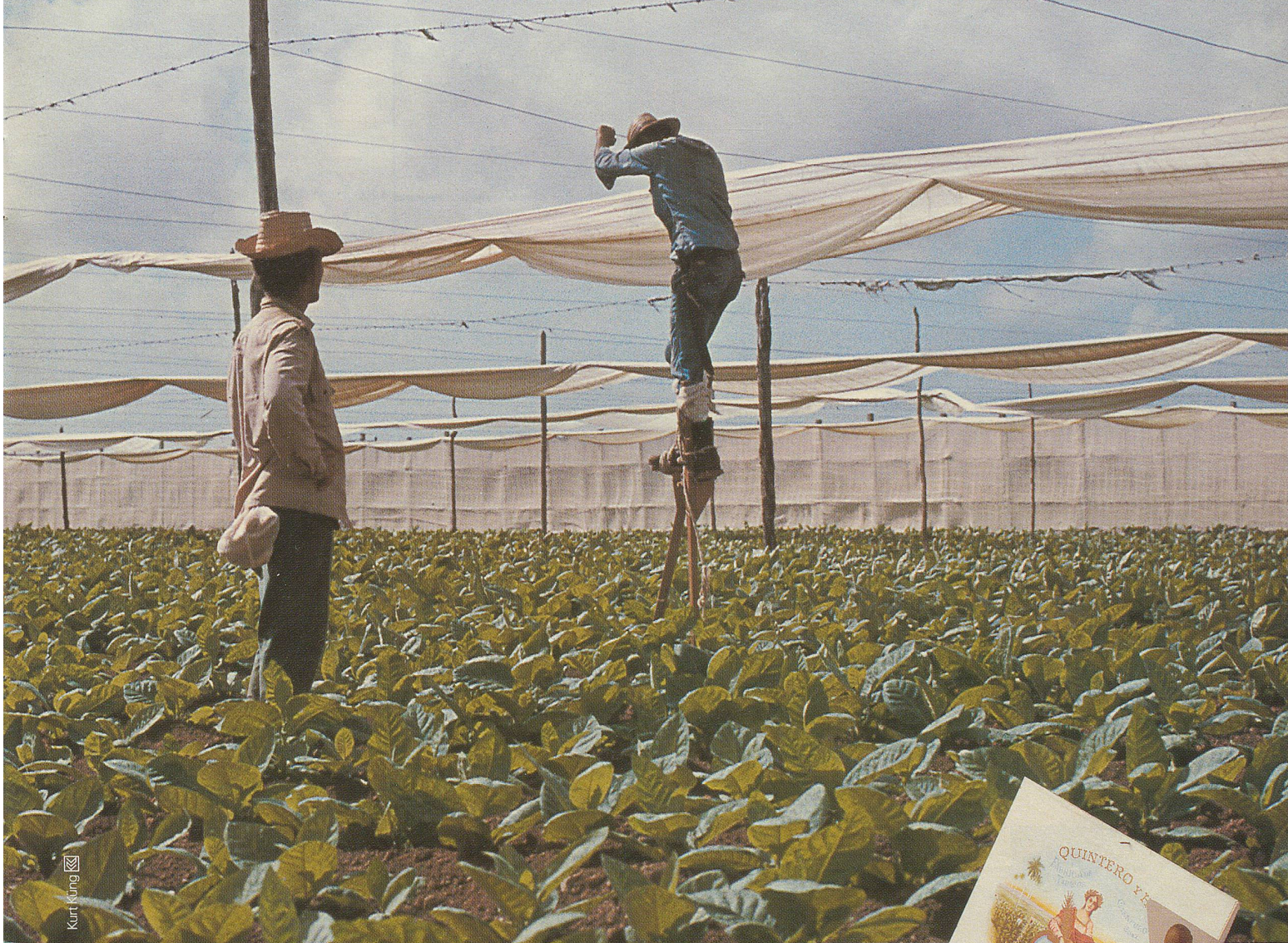
In Pinar del Rio spannen Stelzengänger Leinentücher über die Deckblattplantagen, um die kostbaren Pflanzen vor zuviel Wind und Sonne zu schützen.

Erleben Sie das einzigartige Aroma einer echten Havana-Cigarre.