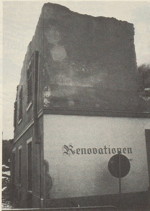
In Chur aufgenommen von Adrian Steiger, Flims

In der nächsten Nummer finden Sie wieder ein