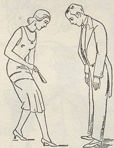
Fig. 38 Damenverbeugung auf der Stelle

tänzen der Fall ist. Ich erinnere an den Tschardas der feurigen Ungarn, die Tarantella der Italiener. Der in den Vereinigten Staaten emporgekommene Neger drückt in Haltung und Gang sei-