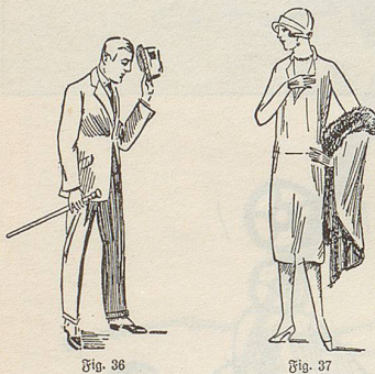
Fig. 36 Verbeugung bei einer Begegnung