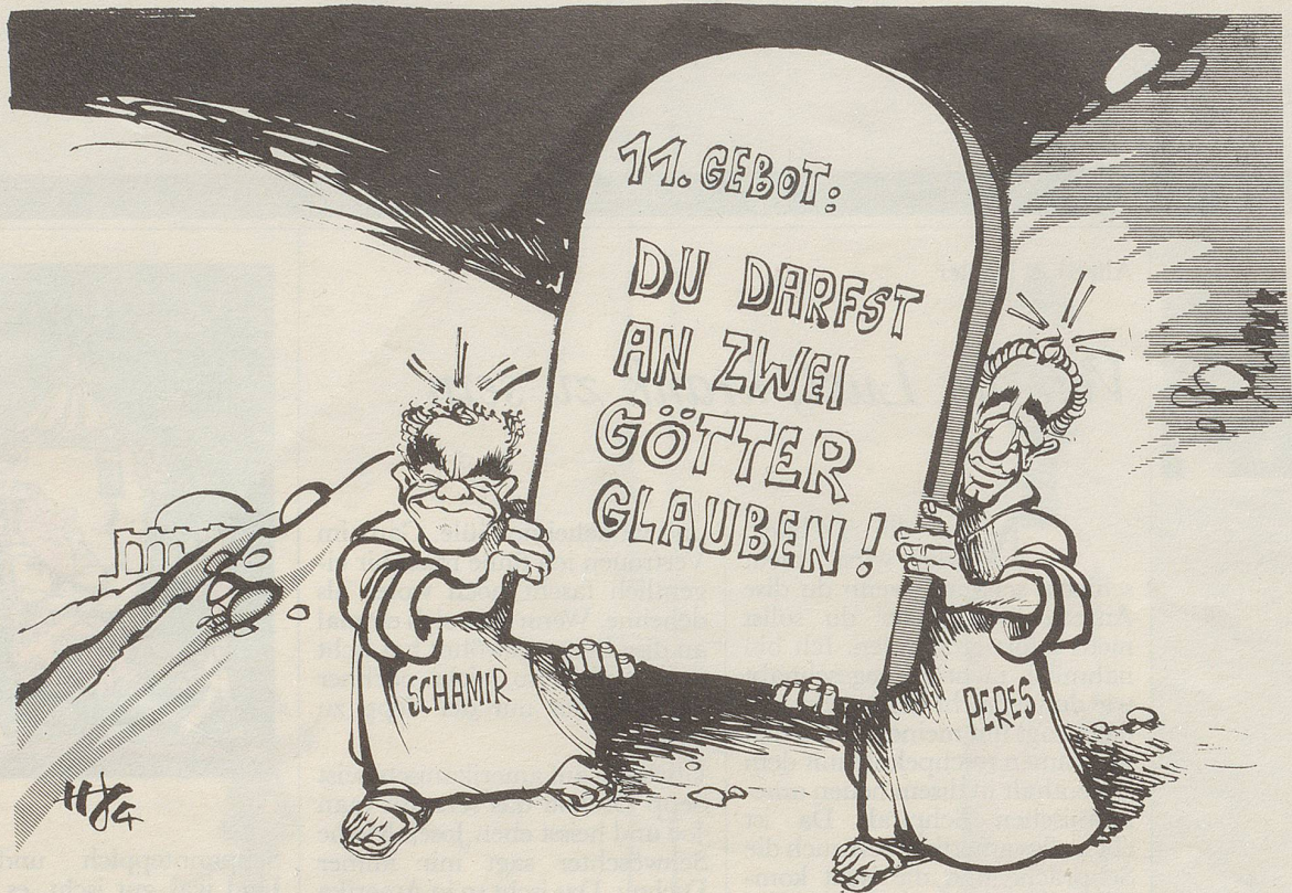
Neues vom Sinai