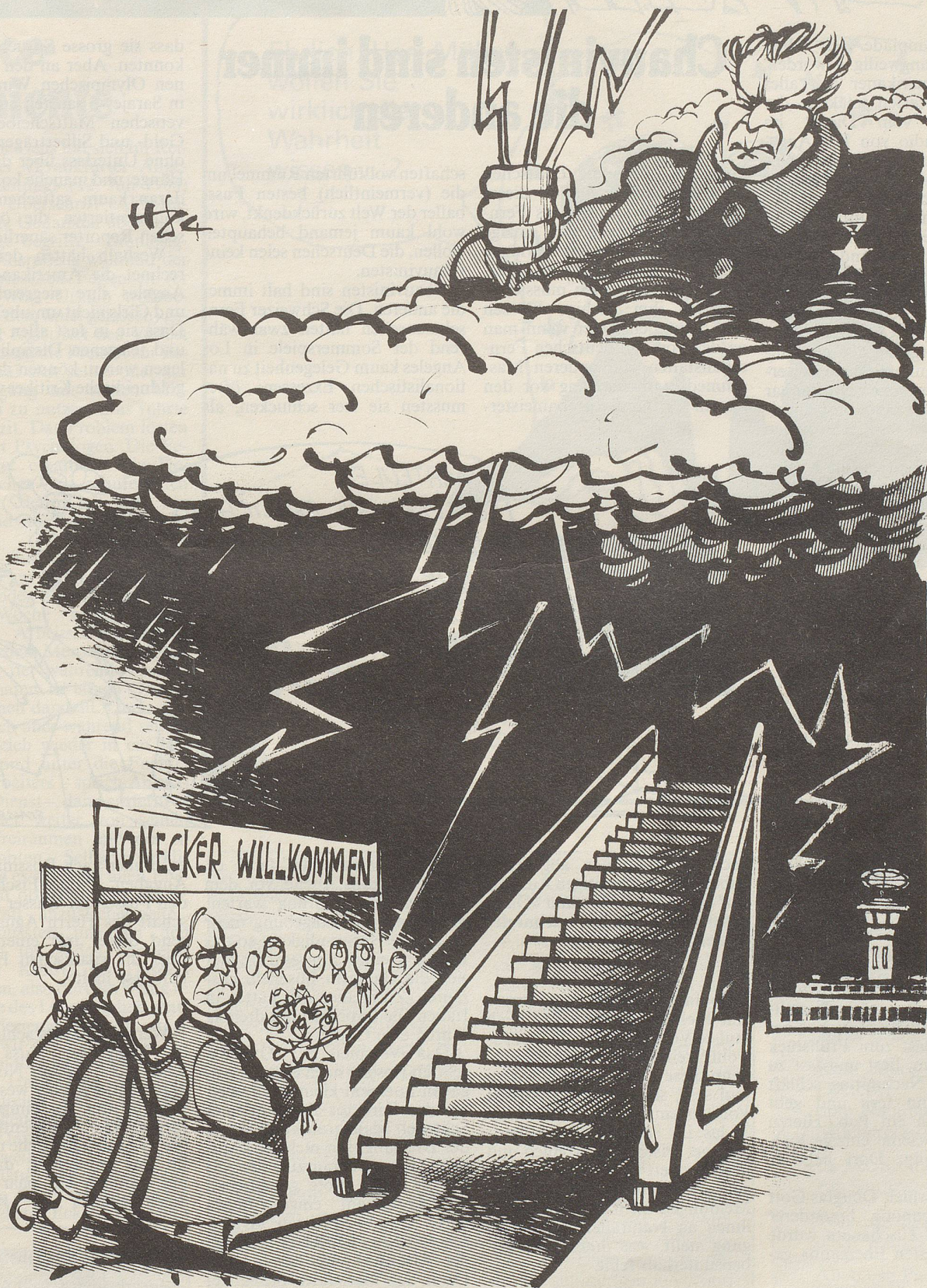
«Hoffentlich kann er bei dem Sauwetter landen!»