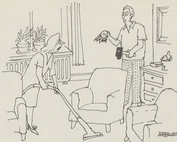
«... und auch weg mit dieser läppischen Vase von Tante Irma. Komisches Fabrikat: Sèvres 1793 ...!»

Nie werde ich einen wohltrainierten, bodygebildeten Körper vorweisen können; ich bin zu faul dazu. Es reicht gerade zu einem anderthalbstündigen Tennis-Mätschen, am liebsten im Doppel, weil's bequemer und gemüthlicher ist, zu einer mehrstündigen Wanderung in den Bergen oder zu ein paar Längen im Schwimmbad, aber – bitteschön – nur kein Gestresse! Es sollte immer noch Spass machen. Ich