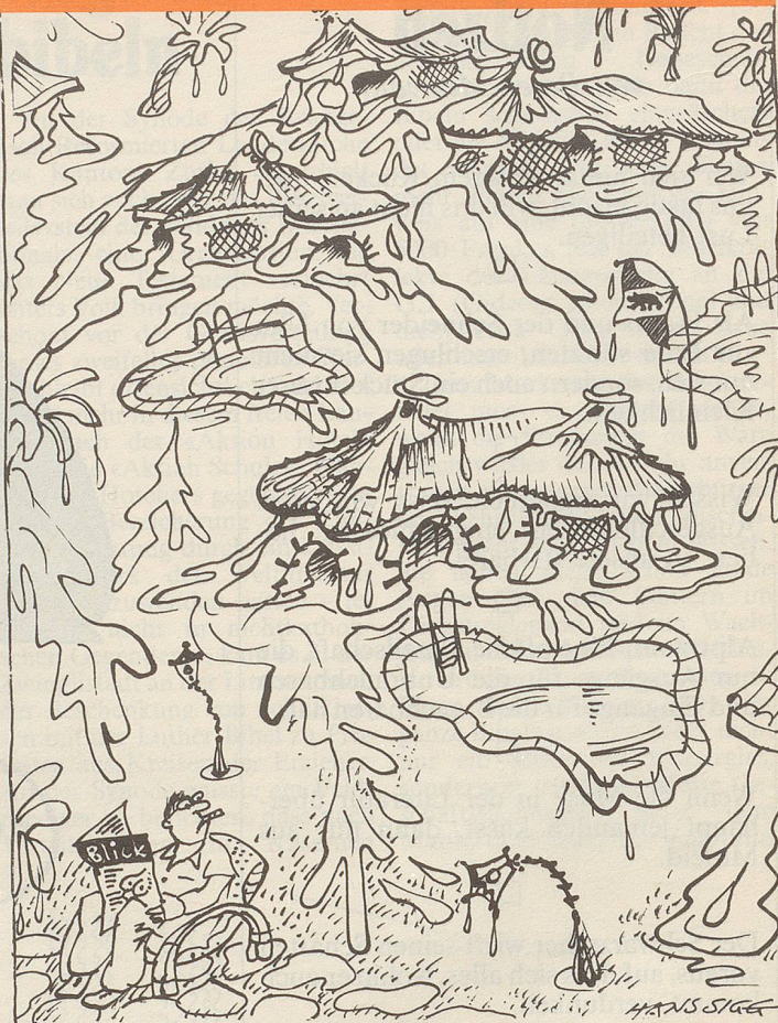
Plötzlicher Wärmeeinbruch im Tessin oder: Schmelzender Kitsch.