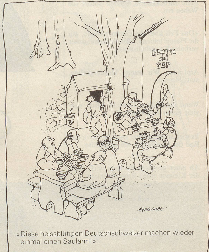
«Diese heissblütigen Deutschschweizer machen wieder einmal einen Saulärm!»