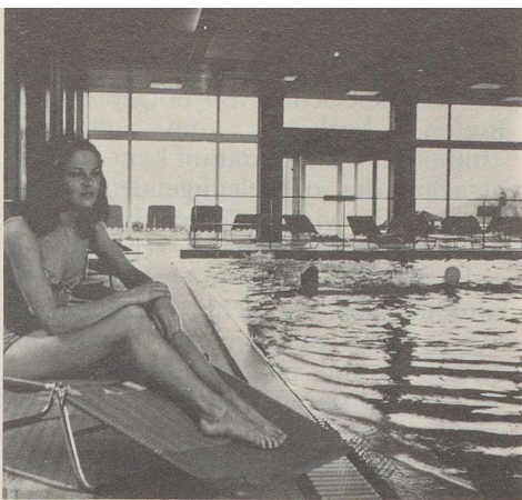
Sole-Hallenbad 33°C, Breiten