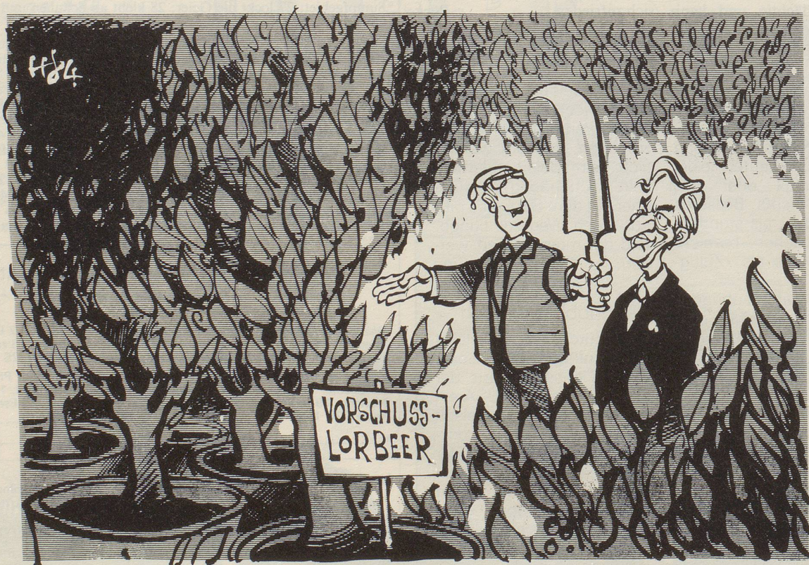
«Herr Bundespräsident, Sie dürfen sich jetzt zu Ihrem Amtssitz durchkämpfen!»