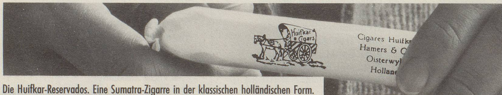
Die Huifkar-Reservados. Eine Sumatra-Zigarre in der klassischen holländischen Form.