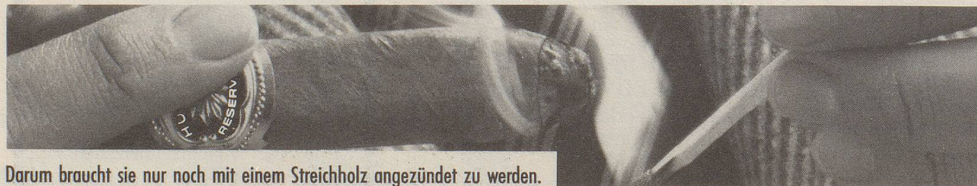
Darum braucht sie nur noch mit einem Streichholz angezündet zu werden.

Von einer Huifkar-Reservados getestet zu werden erfordert keine umfangreichen Vorkenntnisse und ist darum nicht besonders schwierig. Auch wenn Sie sich bis heute nur an Sonn- und Feiertagen oder aus reiner Abwechslung an eine Zigarre heranwagten. Alles, was Sie brauchen, um diesen einmaligen Test bei sich zu Hause, im Büro oder sonstwo erfolgreich zu bestehen, ist ein bisschen Fingerspitzengefühl für die oben dargestellten brenzlichen Situationen. Und natürlich eine leichte und aromatische Huifkar-Reservados, die wir Ihnen nach Erhalt Ihres Coupons gratis zustellen. Alles, was wir von Ihnen wissen möchten, ist, ob Ihnen die Huifkar-Reservados gefällt.