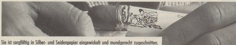
Sie ist sorgfältig in Silber- und Seidenpapier eingewickelt und mundgerecht zugeschnitten.