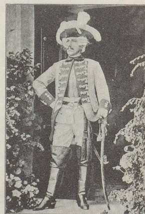
Auch General Rupertus Scipio von Lentulus, ein Berner Söldner im Dienste Friedrichs des Grossen, marschierte munter mit. Der 1714 geborene Haudegen wurde sogar von Voltaire mit einem Vers beehrt, war Träger hoher russischer und preussischer Orden und wurde 1786 auf Monrepos begraben. Lentulus-Rain und Lentulus-Strasse erinnern noch an ihn. Die 1891er Festivitäten schlossen derart auch die eidgenössische Präsenz im Ausland ein.