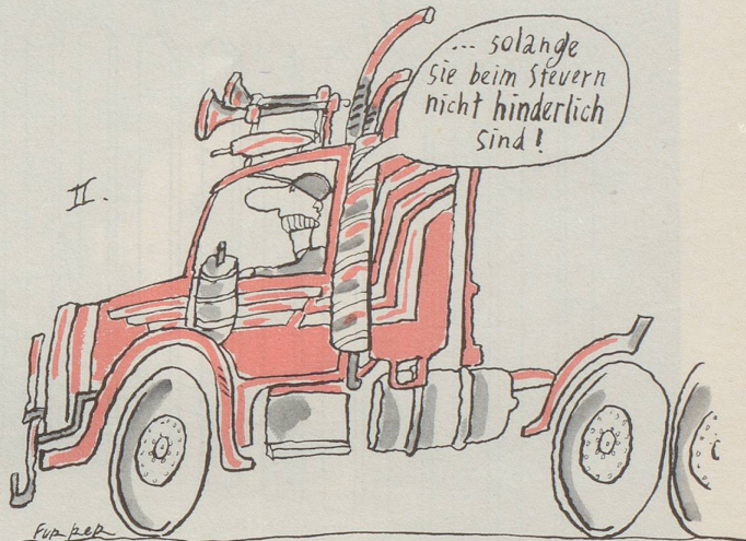
Lastwagen-Chauffeure drohen mit Blockade