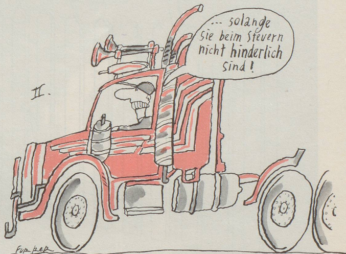
Lastwagen-Chauffeure drohen mit Blockade