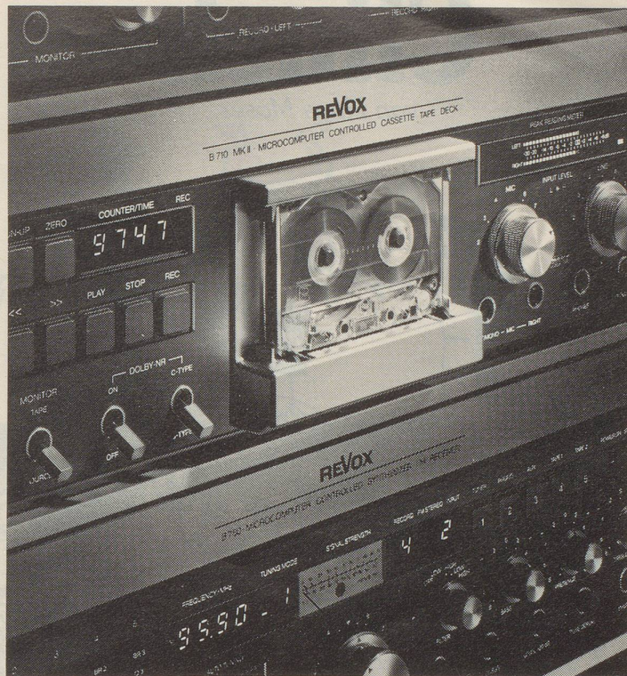
Das neue Revox Cassettendeck B710 MK II mit Dolby B und Dolby C.

Neu Jetzt auch mit Infrarot-Fernsteuerung.